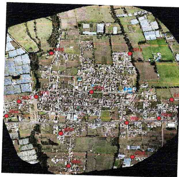
Imagen 1.- Ortofoto Tabacundo y los 13 puntos de control en campo

El criterio básico para el juicio de control estará basada en la obtención de la cartografía a escala 1: 1000 para catastro urbano.